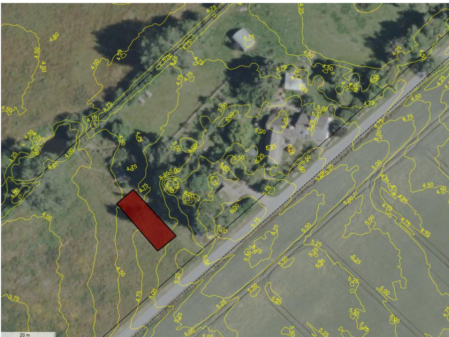
Luftfoto 2026 af ejendommen med terrænkurver. Med rødt rektangel er vist den omtrentlige placering af pilerenseanlægget. Pileanlægget etableres på et nogenlunde plant areal med en højdeforskel på lidt under 1 meter. Overskudsjoeden ved udgravningen til det, især ved det højereliggende terræn nær vejen skal jf. vilkår øverst i denne afgørelse primært bruges til at skabe en mere glidende overgang til eksisterende terræn - så anlægget vil fremstå som en rektangulær plantning uden markante skråningsanlæg på udvendig side.