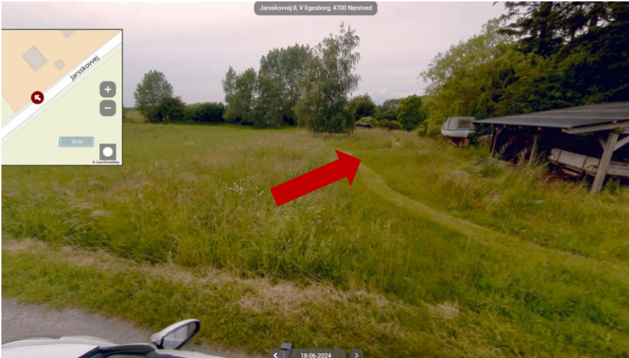
Placeringen af pileanlægget ses her på gadefoto den 18. juni 2024.